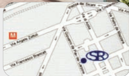
Sede di Acilia